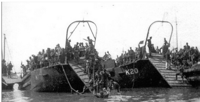
Chalands K lors du débarquement du 8 septembre 1925

Ils furent testés en conditions réelles dans le débarquement du 30 mars 1925.