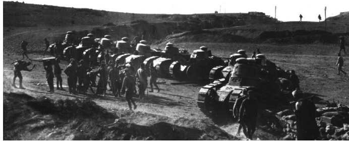
Chars de combat espagnols de construction française Renault FT17 8